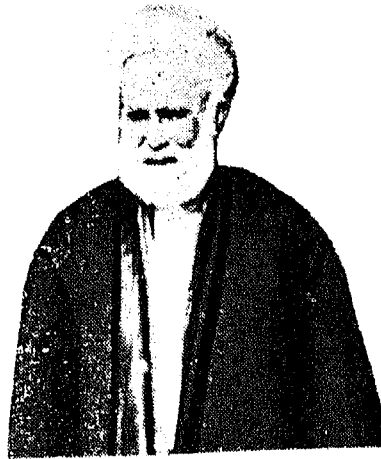
الملك حسين ملك الحجاز

تتابعت النجدات للأمير علي، من مكة وأطرافها، جنداً وقبائل، إلى أن كانت المعركة الفاصلة مساء ٢٦/٢٧ صفر، فاستولى السعوديون على معسكر الأمير علي، في الهداة واستباحواها، وتفرق الهاشميون ومن معهم.